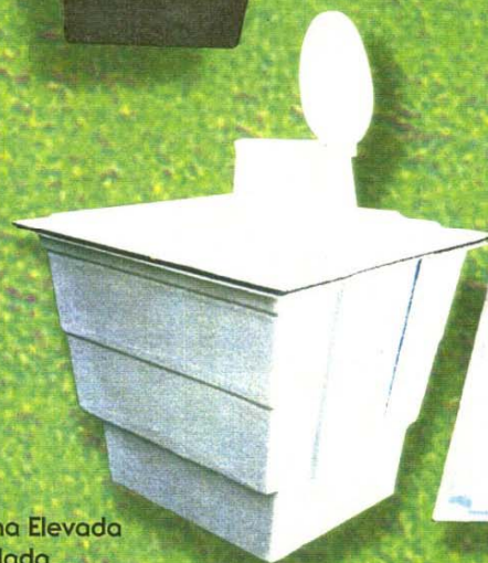
Letrina Elevada Instalada