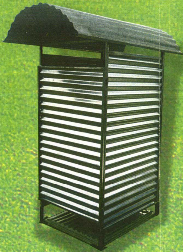
Caseta Sanitaria Convencional con Base MI-36