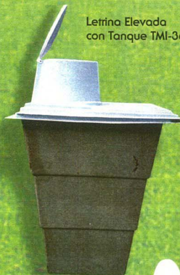
Letrina Elevada con Tanque TMI-36